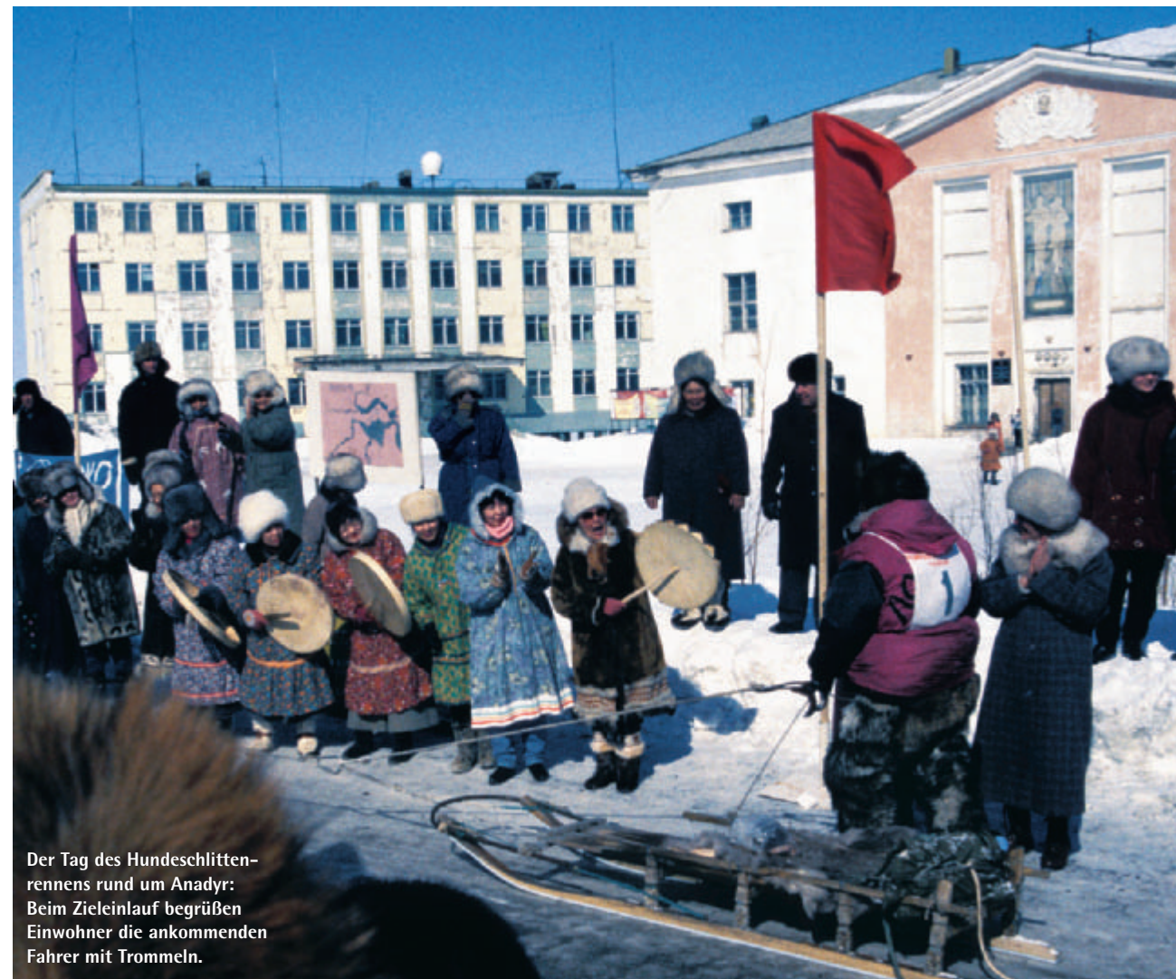
Der Tag des Hundeschlittenrennens rund um Anadyr: Beim Zieleinlauf begrüßen Einwohner die ankommenden Fahrer mit Trommeln.

klärungen für sie zu finden. Grundsätzlich lässt sich sagen: Betrachtet man Fragestellungen wie die nach der Rolle der Industrie, der Reorganisation staatlicher Betriebe und der Verteilung von Eigentum, dann repräsentiert Sibirien sehr gut sowohl die sozialistischen Bedingungen als auch die postsozialistische Transformation. Vergleichende Forschung hilft uns hier nicht nur dabei, ein vollständigeres Bild des russischen Nordens zu erhalten, sondern zeigt auch die Bandbreite der Variationsmöglichkeiten, die für postsozialistische Systeme in ganz Eurasien typisch ist. Unsere Forschung fordert dazu auf, nicht nur Vergleiche mit Sibirien als Ganzem zu ziehen, sondern auch zwischen bestimmten Gegenden innerhalb Sibiriens und Regionen in Osteuropa. Sie lässt Schlussfolgerungen für alle Gesellschaften zu, die eine Umwandlung weg vom Sozialismus durchmachen. ●