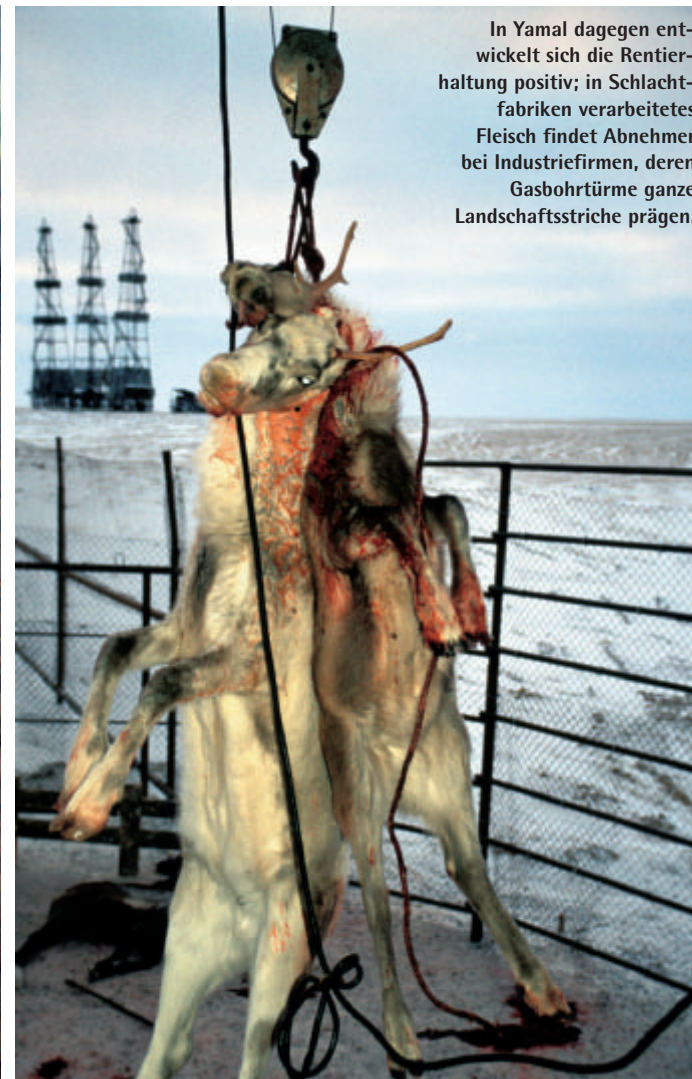
In Yamal dagegen entwickelt sich die Rentierhaltung positiv; in Schlachtfabriken verarbeitetes Fleisch findet Abnehmer bei Industriefirmen, deren Gasbohrtürme ganze Landschaftsstriche prägen.