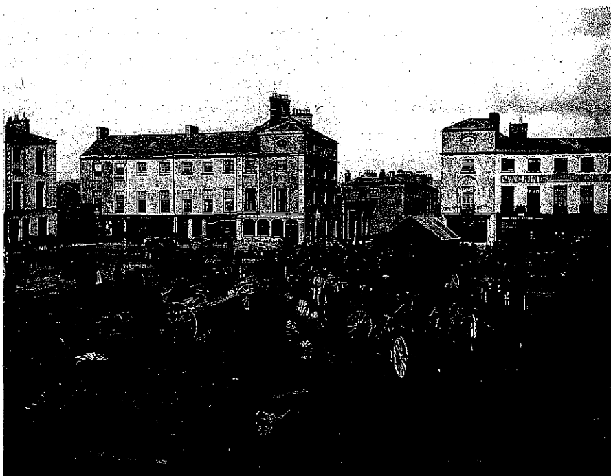
Lá an Aonaigh, Cearnóg Grattan, Dún Garbhán, c. 1900

níl aon amhras ach go raibh díolachán agus ceannachán na bhfeirmeoirí an-thábhachtach do shaol an bhaile um an dtaca seo.